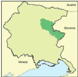
Julische Voralpen und Canin

Osservatorio Meteorologico Regionale via Natisone, 43 33057 Palmanova UD Tel. +39-0432-926831 meteo@arpa.fvg.it www.meteo.fvg.it